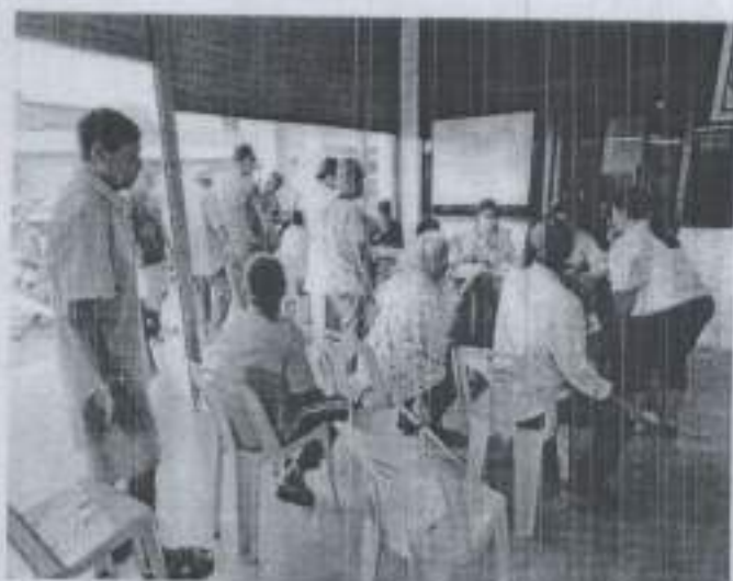
ให้ความรู้การป้องกันโรคติดกหกล้มในผู้สูงอายุ